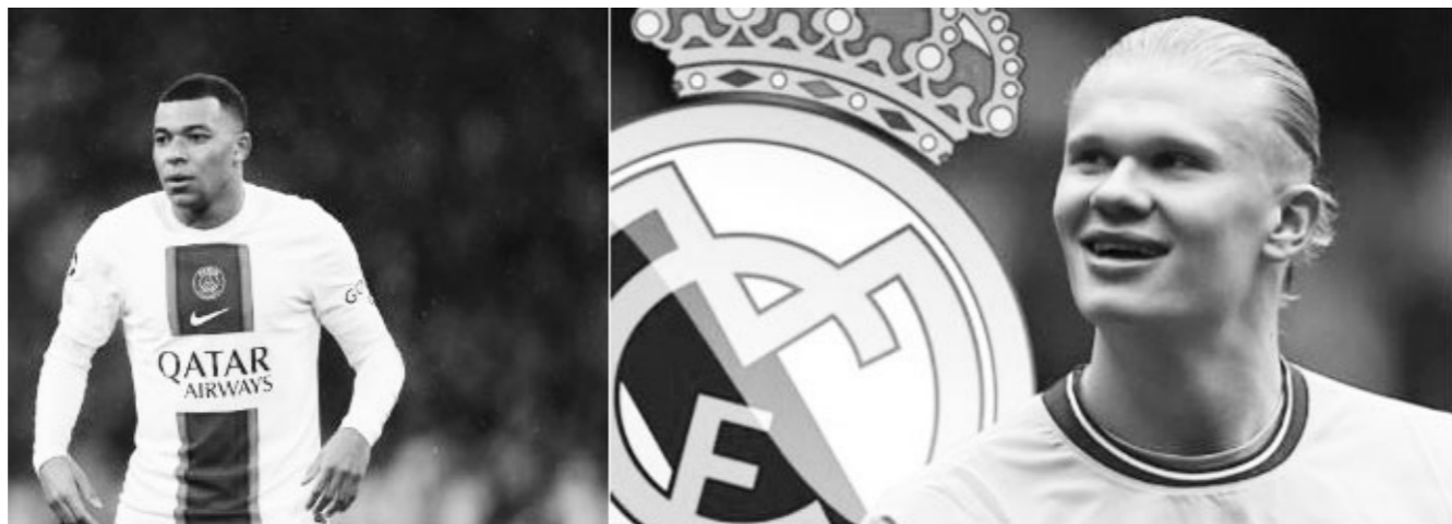
naar de Spaanse hoofdstad te krijgen.

Maar Mbappé zou zijn verwachtingen moeten bijstellen en "veel meer moeten doen" om de club