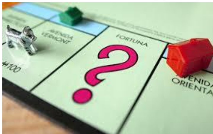
Het vraagstuk van de informele sector

Het belangrijkste obstakel was op de persconferentie zichtbaar. De VHP moet samenwerken met ABOP en PL. Niet erg hoopgevend voor milieu, gender, grondenrechten en tal van andere zaken die in de huidige postkoloniale natiestaat niet aan hun trekken komen. De zwakke middenklasse heeft vooralsnog de prothese van de samenwerking met ABOP nodig om politiek overeind te blijven.