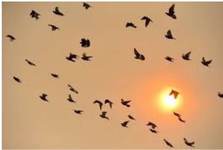
De hemel kleurt oranje

uitgesloten dat men misbruik zal maken van het coronavirus om de machtsoverdracht op de lange baan te schuiven. Het is niet ondenkbaar dat men middels gefabriceerde fraudebeschuldigingen of in elkaar gezette scenario's moeilijkheden gaat veroorzaken. Wat er verder ook gebeurt, overwinning van de VHP heeft een grote impact die nog jaren zal doorwerken.