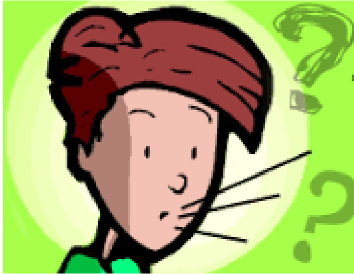
Een vreemde stem

revolutie in onze politiek. Net als alle revoluties dwingt deze ons op een andere manier te praten over de wereld, in ons geval Suriname en de Surinamers.