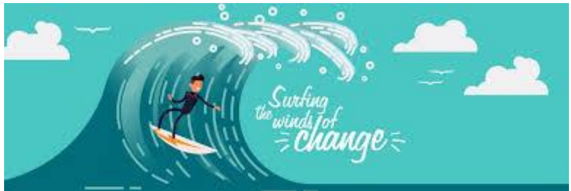
De golf van verandering uitrijden

Elke stagnatie of terugval naar de methoden van de oude VHP zal leiden tot onoverkomelijke moeilijkheden. De democratisering en de modernisering van de partij moeten verder worden doorgevoerd. Men moet niet bang zijn een nieuwe partij op te richten, als de conservatieve bastions dwars gaan liggen, Maar niet alleen dan. Een nieuwe partij zou kunnen dienen als paraplu voor een scala van partijen en groepen met middenklassebelangen binnen en buiten het Parlement.